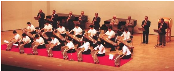
鹿嶋市民音楽祭での演奏風景