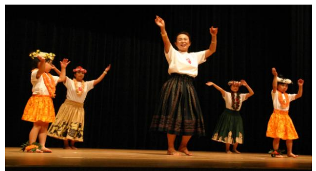
フラ講座 発表会の様子

いつもお世話になっている方から「一緒にやってみない？」とお誘いを受け、初歩から始めましたが、アロハ・カウアイを一曲踊れる様になった時は本当に感動しました。日頃の成果を発表する機会も作って下さり、緊張しますが、先生が一人でステージで踊っている姿を見て、私も少しでも上達して、あんな風に優雅に踊れる様になる！と目標を遠くに見据えながら、隔週金曜日を心待ちにし、頑張っています。