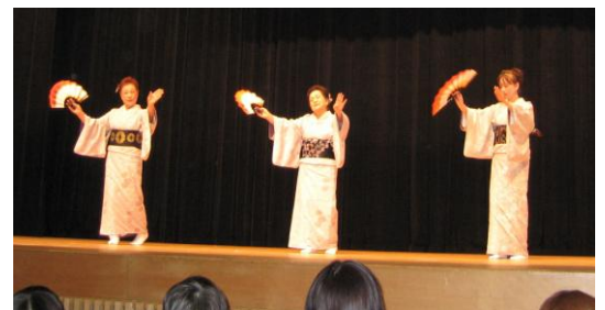
新日本舞踊 発表会の様子

当講座では、実習室の大鏡に舞姿を映しながら、手拍子・足拍子・すり足・巴まわりと、良い汗をかきながら稽古に励んでおります。