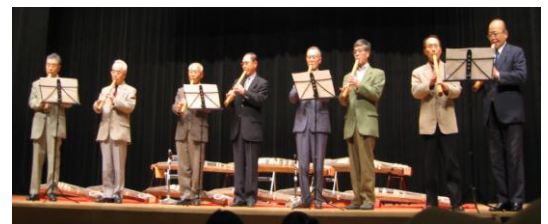
楽習塾での発表会

尺八教室のよさは、志を同じくする仲間との練習が楽しみ、適度なプレッシャも出てきて、尺八の習熟を高めていく上で大切な「続ける」ことへの大きな支えとなっていることだと思います。目標と、その成果を試す場が提供される、かしま灘楽習塾の存在意義を改めて実感しているところです。