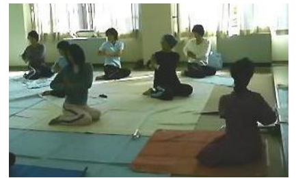
ヨーガの講座風景

ヨーガ初体験の私は、体が硬くて曲げる動作もままならず、メタボのお腹も邪魔をしてなかなか思うように体が動いてくれませんでした。初めて聞く言葉（マントラ）を発しながら、その声に合わせて動いていくのですが、不思議な気持ちと不安感（頭の中には、“これは何か変！？ オーム教なのでは、帰りに断らなくっちゃ”）が募り、あっと言う間に時間が過ぎたように思いました。