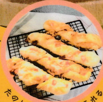
たのしい成形もおぼえられる