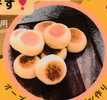
オーブンだけじゃないパン作り