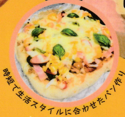
時短で生活スタイルに合わせたパン作り